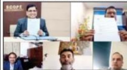
MoU signing between SCOPE & IMTH.

digitalization is one of biggest differentiators in an organisation's performance today and stipulated that the study aims at moving beyond data analysis and understanding internal efficiencies, external components of digitalisation and ways to accelerate digital